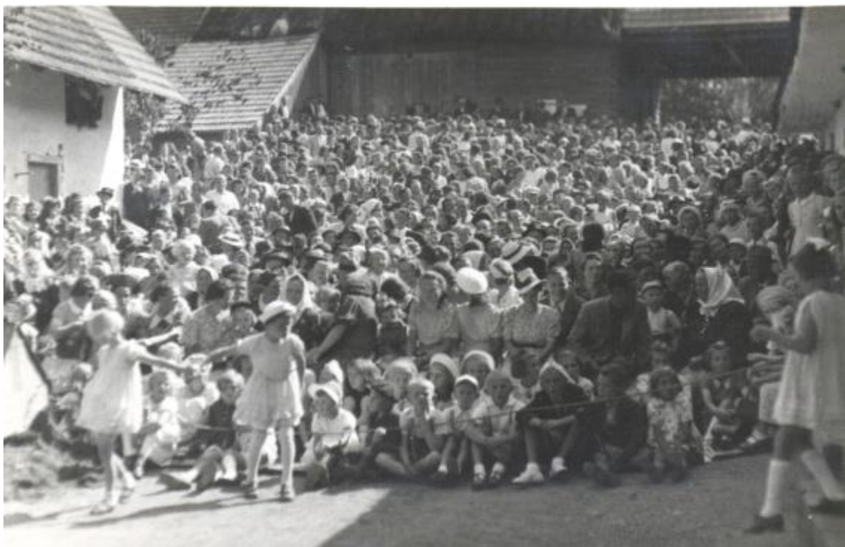
Divadelní představení Pasekáři ( Žichlice rok 1940 )

Těm, kteří přispěli do tohoto čísla, děkujeme.